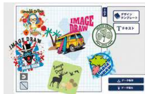
Image Former DRAW

お客様から依頼したシステムを作るだけでなく、自社で考案した3Dシミュレーターを活用したサービスも行い、システム開発から販売・管理までを一貫して行う事業です。現在は「Image Former DRAW」、「Image Former 3D」を中心に、さまざまなシステム開発を行っています。